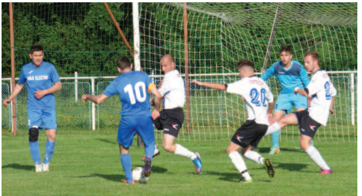
Meglepetésre a názánfalviak szereztek az első gólt